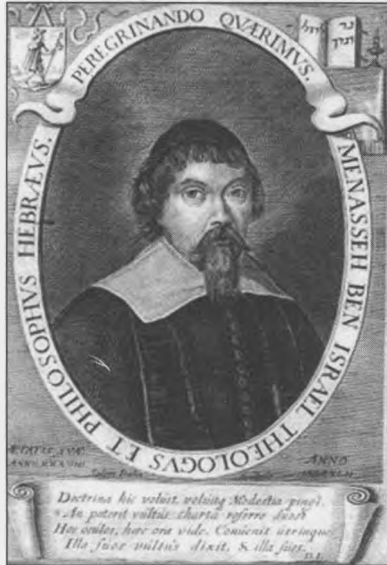
Menasseh Ben Israel

στούς Ἑβραίους ἓνα καθεστῶς διαβίωσης πού ὀρίζει καί τίς προϋποθέσεις ἐγκατάστασης. Ἀπαγορεύεται κάθε εἶδους προσηλυτισμός ἐκ μέρους τους, καθῶς καί κάθε εἶδους σχέση μέ γυναῖκες χριστιανές ἢ μέ τό λιανικό ἐμπόριο. Τούς διατάζουν νά ἀσκοῦν τήν ὀρθόδοξη ἰουδαϊκή λατρεία ὥστε νά μὴν δημιουργηθοῦν καί ἄλλα σχισματικά ρεύματα στή νεοσύστατη Δημοκρατία. Ἡ κοινότητα αὐτή πού ποτέ δέν ξεπέρασε τά 2.000 ἄτομα, θά γνωρίσει μεγάλη ἀνθηση καί θά γίνει ἡ διτρίνα τοῦ παγκόσμιου ἰουδαϊσμοῦ τόν 17ο αἰῶνα. Θά ἀναδειχθοῦν ἐδῶ μεγάλες φυσιογνωμίες. Ὁ Ρέμπραντ κατοικεῖ στήν ἑβραϊκή γειτονιά. Ἀποτυπώνει σέ χαρακτηριστικά καί ζωγραφικούς πίνακες τούς κατοίκους της. Αὐτό πού τούς ἐνώνει εἶναι ἡ παγκοσμιότητα: ὁ Ρέμπραντ θά χαράξει τέσσερα χαρακτηριστικά πού θά εἰκονογραφήσουν τό ἔργο La Piedra Gloriosa τοῦ φίλου του ραβίνου Μενασσέχ μπέν Ἰσραέλ 10 .