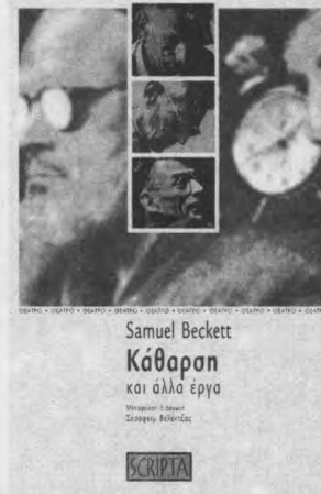
SAMUEL BECKETT ΚΑΘΑΡΣΗ ΚΑΙ ΑΛΛΑ ΕΡΓΑ ISBN 960-7909-34-8