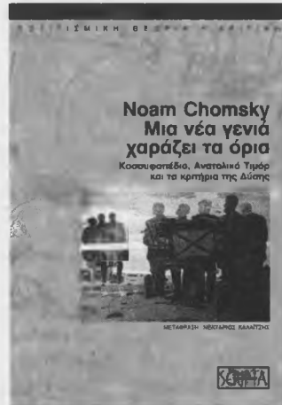
NOAM CHOMSKY ΜΙΑ ΝΕΑ ΓΕΝΙΑ ΧΑΡΑΖΕΙ ΤΑ ΟΡΙΑ ISBN 960-7909-35-6