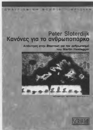
PETER SLOTERDIJK ΚΑΝΟΝΕΣ ΓΙΑ ΤΟ ΑΝΘΡΩΠΟΠΑΡΚΟ ISBN 960-7909-36-4